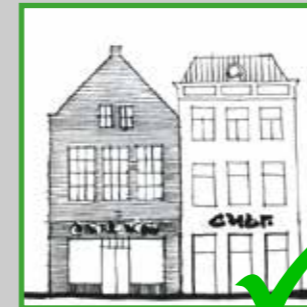
elk pand met de "voeten" op de grond