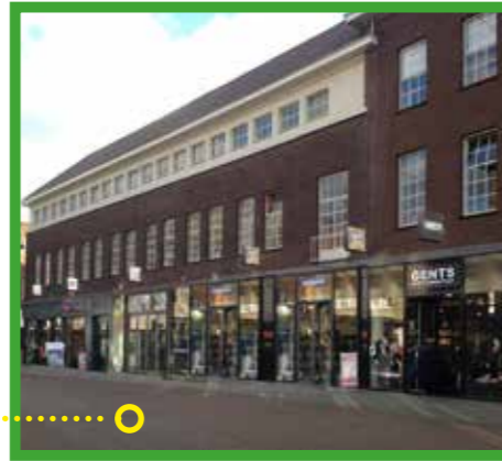
Verschillende winkels in één pand hebben dezelfde uitstraling door het gebruik van dezelfde materialen, kleuren en maatvoeringen.